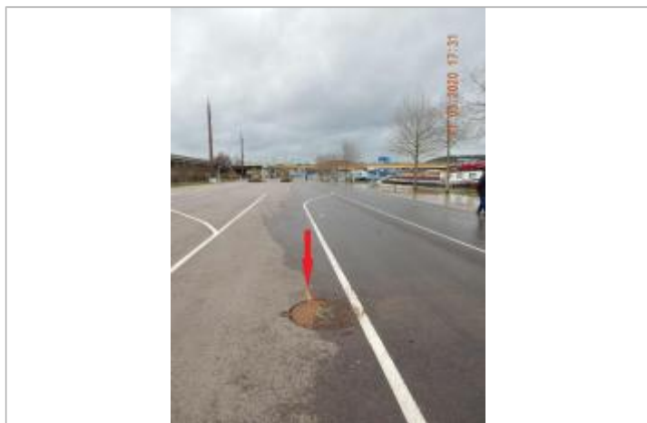
Marque de peinture au sol sur le quai à l'Est du pont Guillaume le Conquérant

NIVELLEMENT SPC SACN. LE SPC N'EST PAS GÉOMÈTRE EXPERT, LES COTES SONT DONNÉES À TITRE INDICATIF. - 05/08/2020