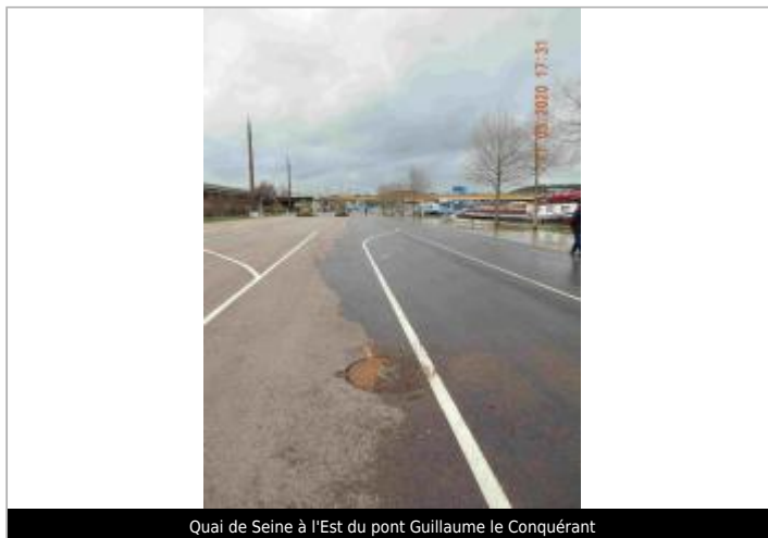
Quai de Seine à l'Est du pont Guillaume le Conquérant