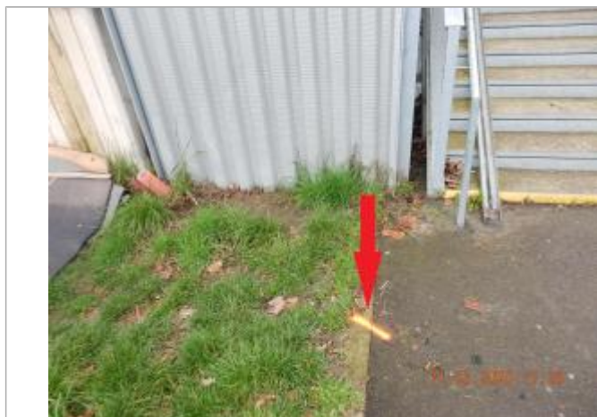
Marque de peinture au pied de l'escalier du pont Guillaume le Conquérant

NIVELLEMENT SPC SACN. LE SPC N'EST PAS GÉOMÈTRE EXPERT, LES COTES SONT DONNÉES À TITRE INDICATIF. - 05/08/2020