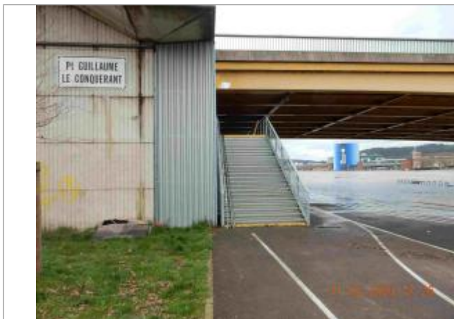
Quai de Seine à l'Est du pont Guillaume le Conquérant