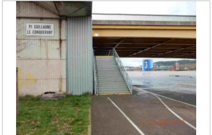
Quai de Seine à l'Est du pont Guillaume le Conquérant