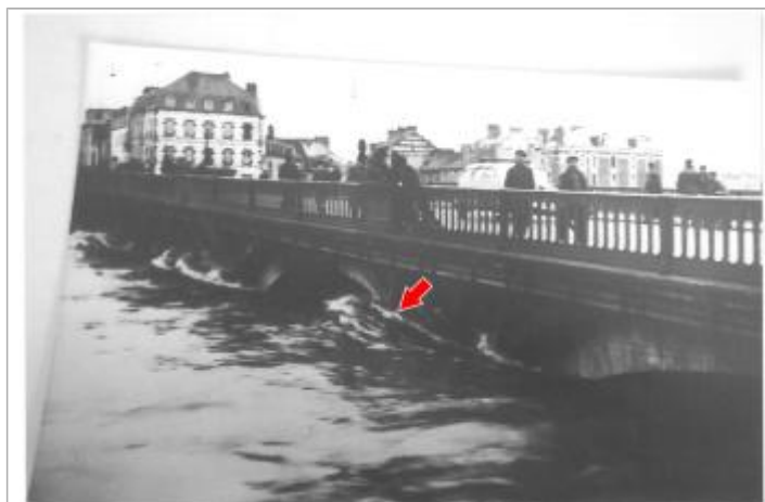
Photographie d'archive de 1940

Altitude calculée de l'eau (en m) : 202.07 m