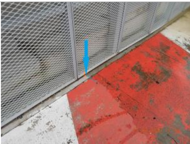
Marque de peinture au sol sur la grille du bâtiment

NIVELLEMENT SPC SACN. LE SPC N'EST PAS GÉOMÈTRE EXPERT, LES COTES SONT DONNÉES À TITRE INDICATIF. - 05/08/2020