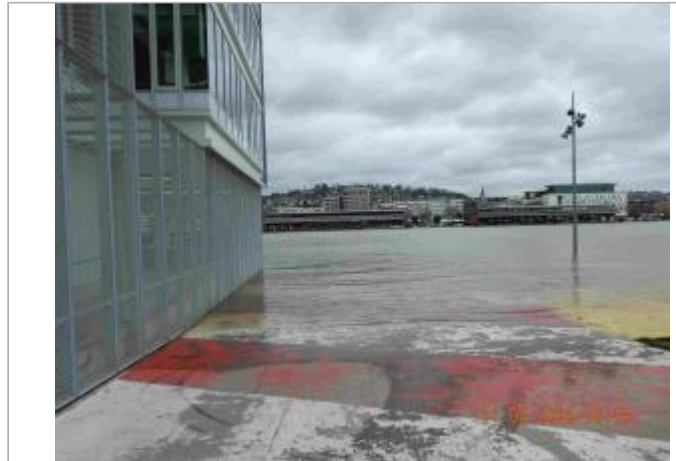
Quai de Seine à l'Est du bâtiment de la Métropole

Coordonnées WGS84 : X: 1.07139420 / Y: 49.44134200