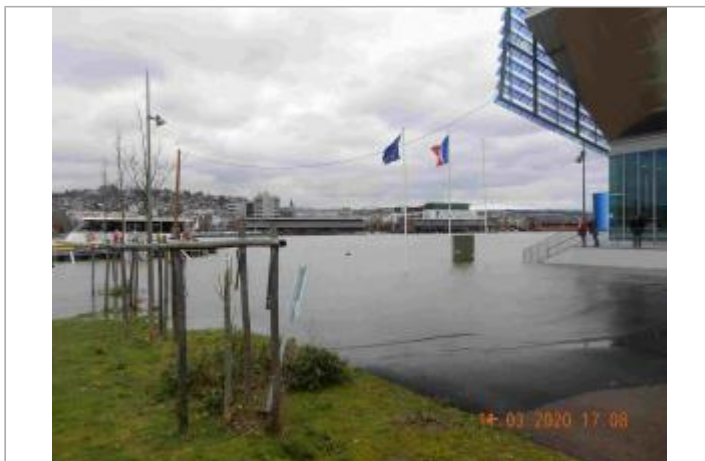
Quai de Seine à l'Ouest du bâtiment de la Métropole