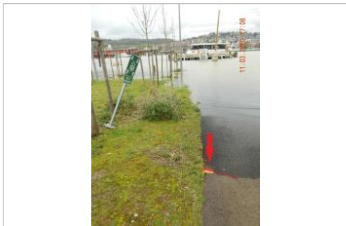
Marque au sol face au panneau de rassemblement

NIVELLEMENT SPC SACN. LE SPC N'EST PAS GÉOMÈTRE EXPERT, LES COTES SONT DONNÉES À TITRE INDICATIF. - 05/08/2020