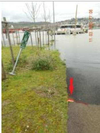
Marque au sol face au panneau de rassemblement

NIVELLEMENT SPC SACN. LE SPC N'EST PAS GÉOMÈTRE EXPERT, LES COTES SONT DONNÉES À TITRE INDICATIF. - 05/08/2020