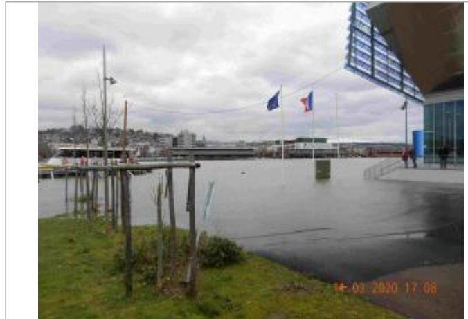
Quai de Seine à l'Ouest du bâtiment de la Métropole

Coordonnées WGS84 : X: 1.07003370 / Y: 49.44174700