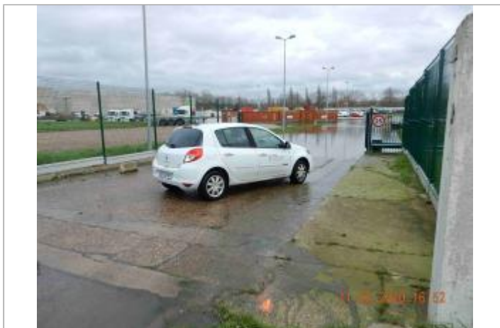
Rue de l'industrie entreprise Lefebure