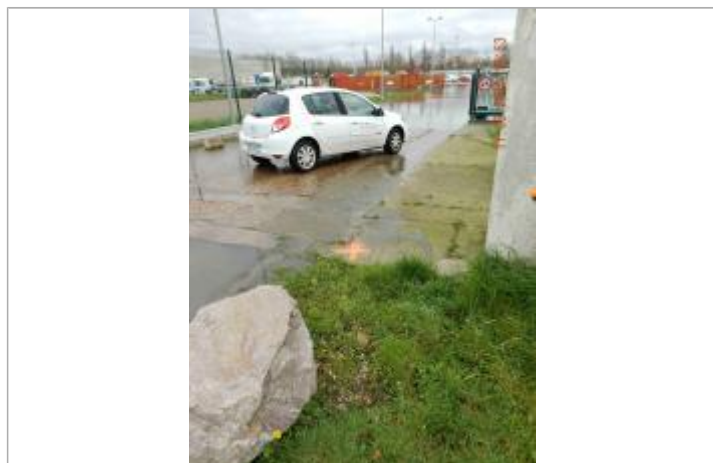
Marque de peinture au sol devant entrée Parking

NIVELLEMENT SPC SACN. LE SPC N'EST PAS GÉOMÈTRE EXPERT, LES COTES SONT DONNÉES À TITRE INDICATIF. - 05/08/2020