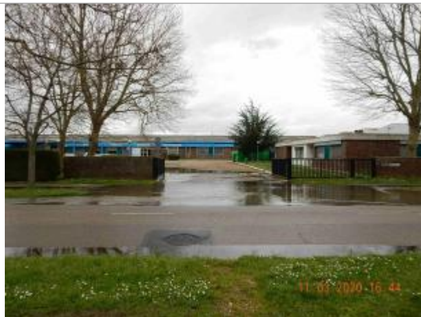
Boulevard Pierre Brossolette face à la société Bodet