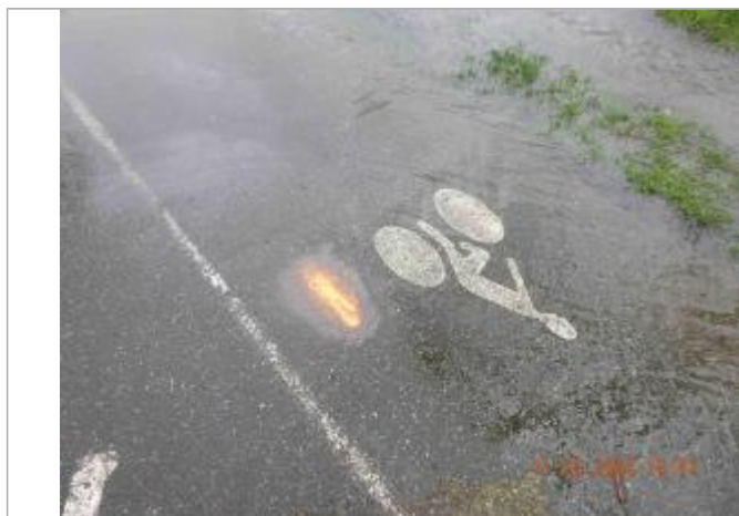
Marque de peinture au sol sur piste cyclable devant société Bodet

NIVELLEMENT SPC SACN. LE SPC N'EST PAS GÉOMÈTRE EXPERT, LES COTES SONT DONNÉES À TITRE INDICATIF. - 05/08/2020