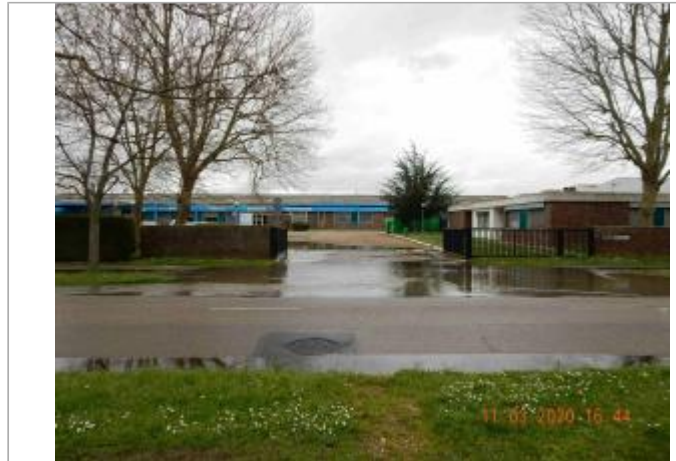
Boulevard Pierre Brossolette face à la société Bodet

Coordonnées WGS84 : X: 1.03302500 / Y: 49.41824300