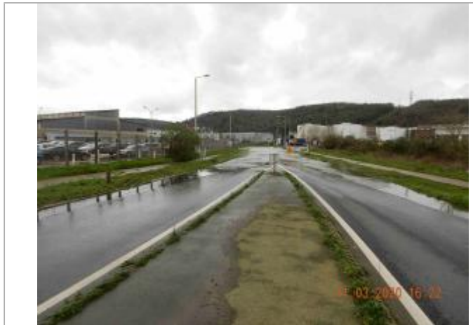
Rue Pierre Brossolette face à la société Boréal

Coordonnées WGS84 : X: 1.02651820 / Y: 49.41984400