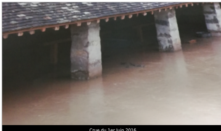
Crue du 1er Juin 2016