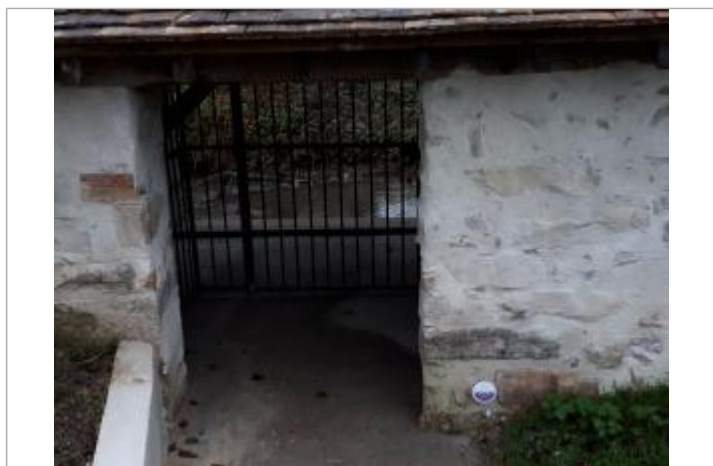
Repère de crue - Seine et Marne Environnement

Texte : 1 JUIN 2016 Plus hautes eaux connues Orvanne Visibilité : Oui État du repère : Bon