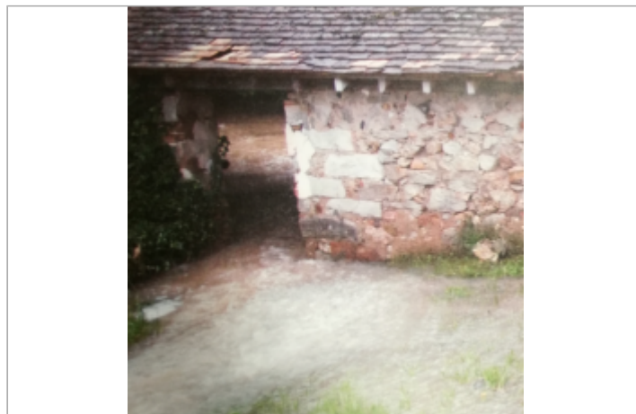
Crue du 1er Juin 2016