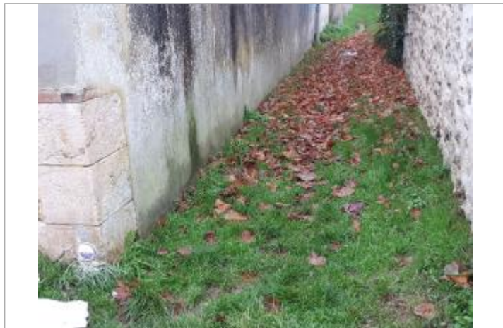
Repère de crue - Seine et Marne Environnement