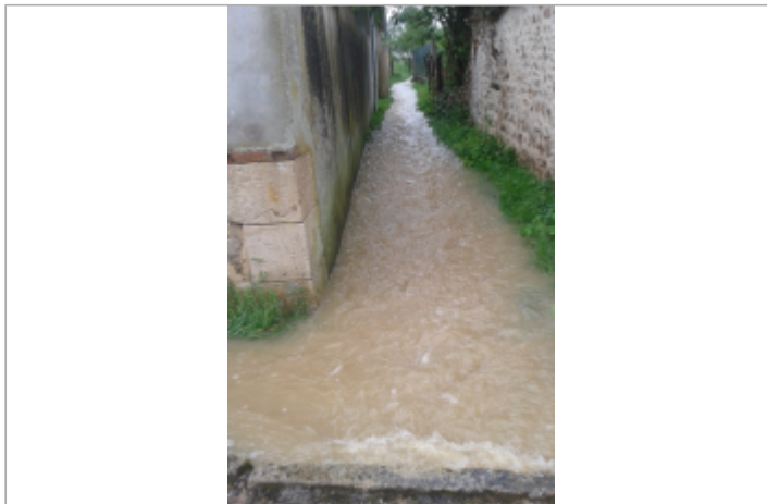
Crue du 1er Juin 2016