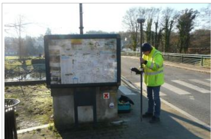
Repère de crue - Seine et Marne Environnement