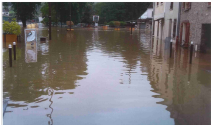
Crue du 1er Juin 2016

Coordonnées WGS84 : X: 2.99192000 / Y: 48.81315000