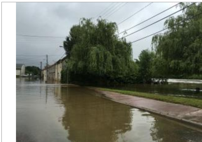
Inondation au 3 juin 2016