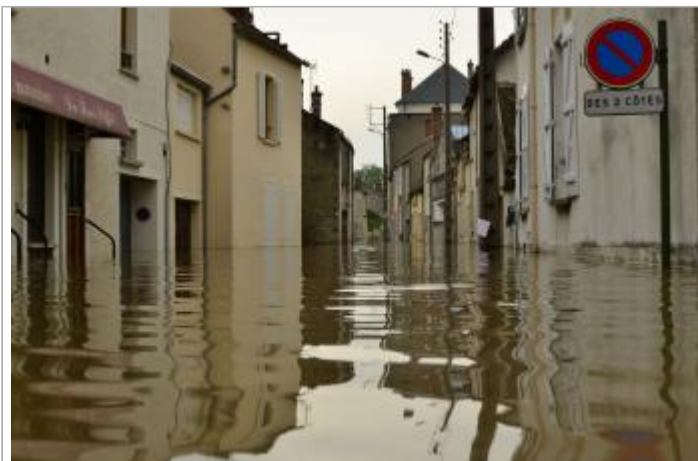
Inondation au 1er juin 2016