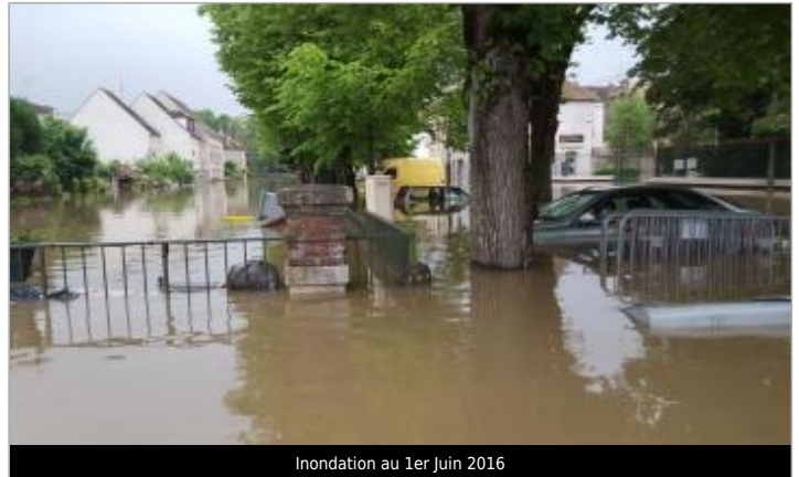
Inondation au 1er Juin 2016

GÉOLOCALISATION Coordonnées WGS84 : X: 2.69334000 / Y: 48.26544000 Coordonnées RGF93 (Lambert 93) X: 677244.04 / Y: 6796166.72 Coordonnées RGF93 (ETRS89) : X: 2.69334 / Y: 48.26544 Code Hydro: F4--0200 Rive de référence: