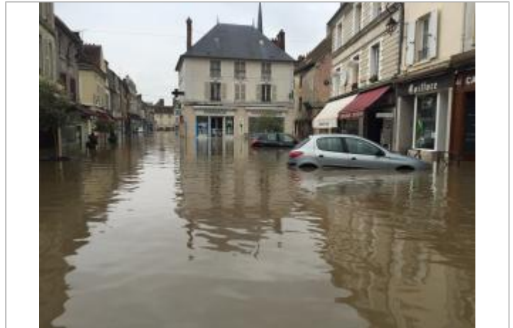
Inondation au 1er juin 2016