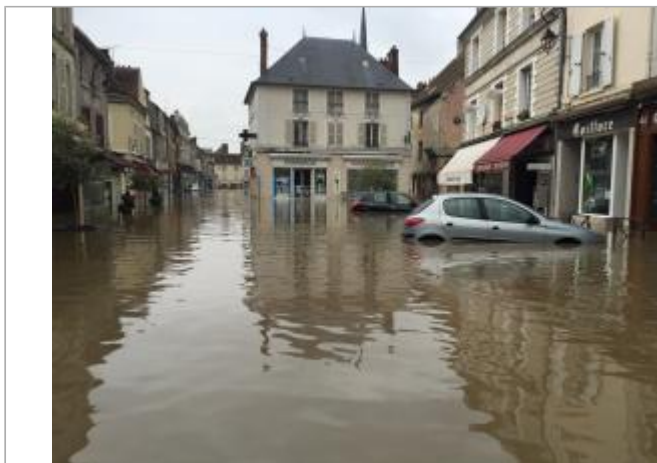
Inondation au 1er juin 2016