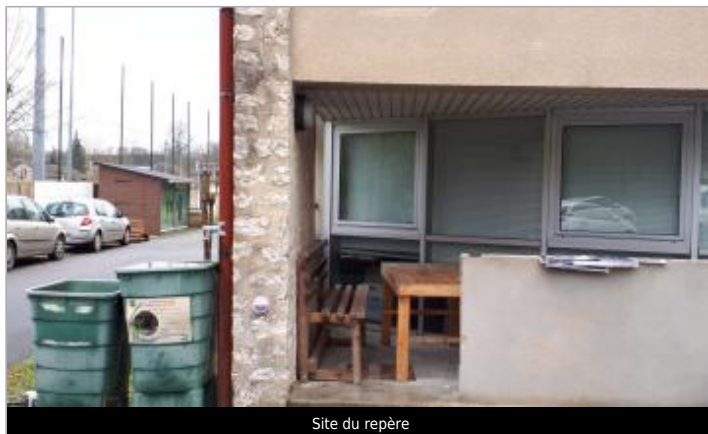
Site du repère

GÉOLOCALISATION Coordonnées WGS84 : X: 2.82310000 / Y: 48.37473000 Coordonnées RGF93 (Lambert 93) : X: 686900.18 / Y: 6808284.39 Coordonnées RGF93 (ETRS89) : X: 2.8231 / Y: 48.37473 Code Hydro: F4--0200 Rive de référence: