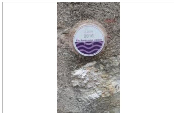
Repère de crue - Seine et Marne Environnement

GÉNÉRAL Code : WEB_R_202004174558 Date de mise à jour : 17/04/2020 Auteur : SEME-EAUZH