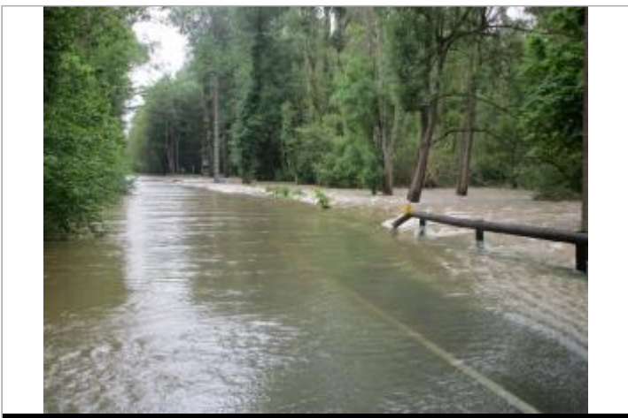
Inondation au 1er Juin 2016

GÉOLOCALISATION Coordonnées WGS84 : X: 2.70641000 / Y: 48.31075000 Coordonnées RGF93 (Lambert 93) X: 678232.63 / Y: 6801198.92 Coordonnées RGF93 (ETRS89) : X: 2.70641 / Y: 48.31075 Code Hydro: F4--0200 Rive de référence: