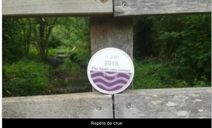
Repère de crue

MARQUE Texte : 1 JUIN 2016 Plus hautes eaux connues Loing Visibilité : Oui État du repère : Bon