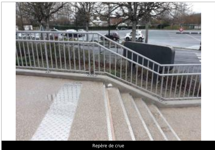
Repère de crue

MARQUE Texte : 2 JUIN 2016 Plus hautes eaux connues Seine Visibilité : Oui État du repère : Bon