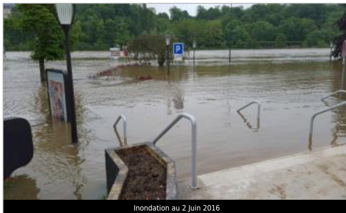
Inondation au 2 Juin 2016

GÉOLOCALISATION Coordonnées WGS84 : X: 2.66670000 / Y: 48.53008000 Coordonnées RGF93 (Lambert 93) X: 675391.37 / Y: 6825589.96 Coordonnées RGF93 (ETRS89) : X: 2.6667 / Y: 48.53008 Code Hydro: ----0010 Rive de référence: