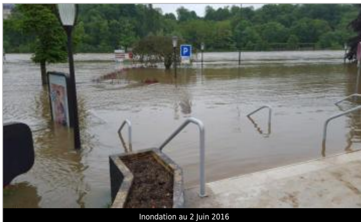
Inondation au 2 Juin 2016

GÉOLOCALISATION Coordonnées WGS84 : X: 2.66670000 / Y: 48.53008000 Coordonnées RGF93 (Lambert 93) X: 675391.37 / Y: 6825589.96 Coordonnées RGF93 (ETRS89) : X: 2.6667 / Y: 48.53008 Code Hydro: ----0010 Rive de référence: