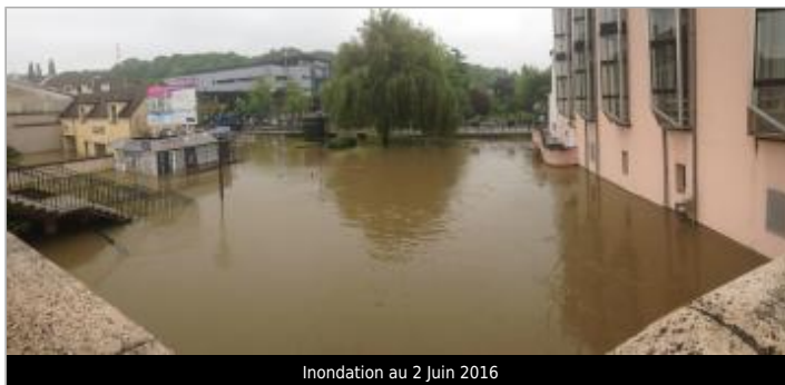
Inondation au 2 Juin 2016

GÉOLOCALISATION Coordonnées WGS84 : X: 2.66380000 / Y: 48.53912000 Coordonnées RGF93 (Lambert 93) X: 675181.54 / Y: 6826595.79 Coordonnées RGF93 (ETRS89) : X: 2.6638 / Y: 48.53912 Code Hydro: F44-0400 Rive de référence: