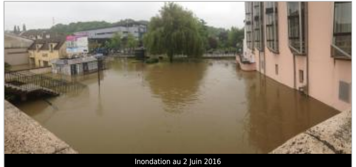
Inondation au 2 Juin 2016

GÉOLOCALISATION Coordonnées WGS84 : X: 2.66380000 / Y: 48.53912000 Coordonnées RGF93 (Lambert 93) X: 675181.54 / Y: 6826595.79 Coordonnées RGF93 (ETRS89) : X: 2.6638 / Y: 48.53912 Code Hydro: F44-0400 Rive de référence: