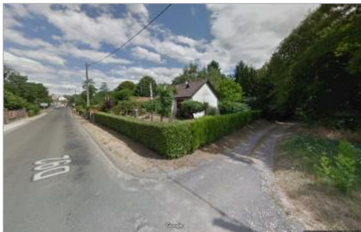
Vue du site en 2013