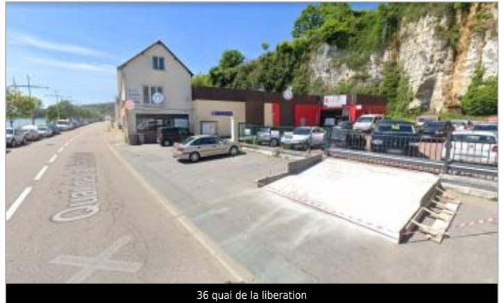
36 quai de la libération