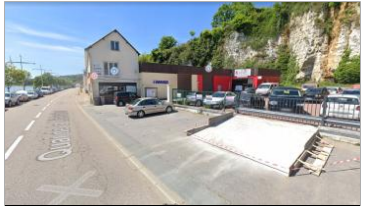
36 quai de la libération