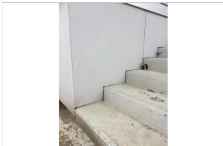
la crue atteint la 3e marche de l'escalier d'accès

Altitude calculée de l'eau (en m) : 5.415 m