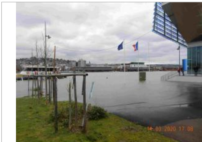
Quai de Seine à l'Ouest du bâtiment de la Métropole