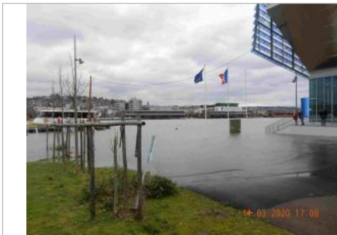
Quai de Seine à l'Ouest du bâtiment de la Métropole