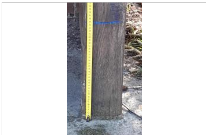
bord droit de l'abri bus

Maximum de l'inondation : Oui Visibilité : Oui État du repère : Moyen Pérennité : Moyenne