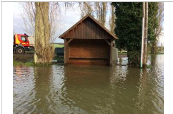
abri bus en RD 64