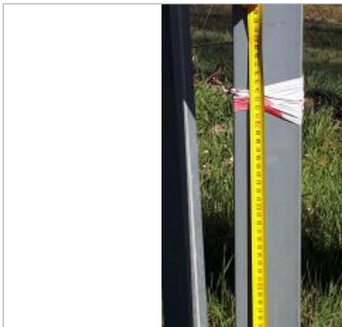
la crue a atteint la rubalise