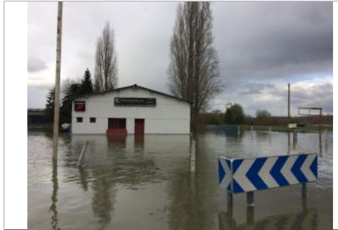
panneau de signalisation au niveau du carrefour