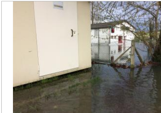
crue de la seine le 12 mars 2020 après midi