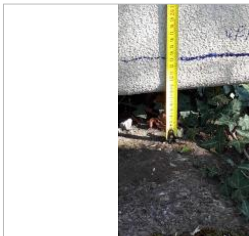
hauteur de l'eau au niveau du transformateur

NIVELLEMENT SPC SACN. LE SPC N'EST PAS GÉOMÈTRE EXPERT, LES COTES SONT DONNÉES À TITRES INDICATIF. - 05/03/2021