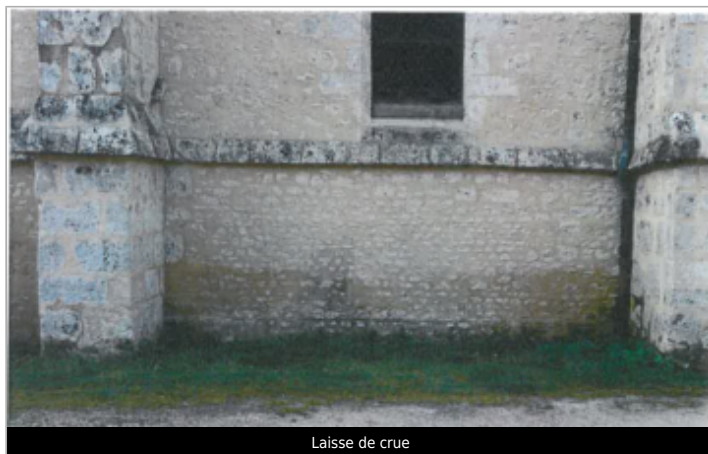
Laisse de crue