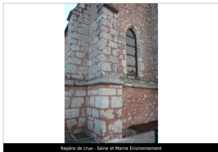
Repère de crue - Seine et Marne Environnement