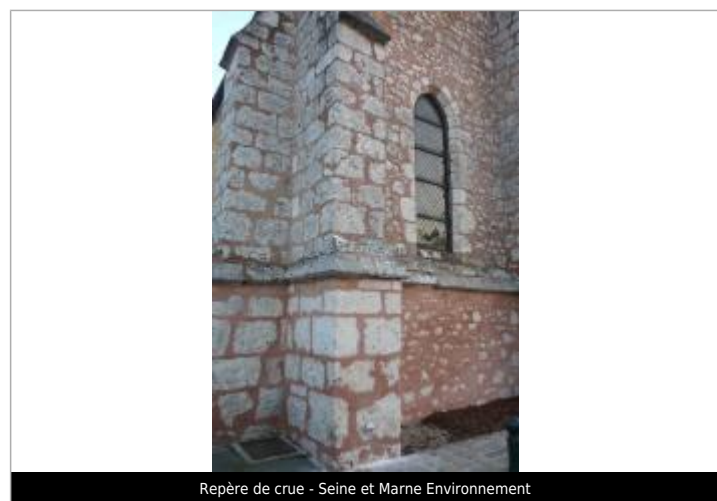
Repère de crue - Seine et Marne Environnement