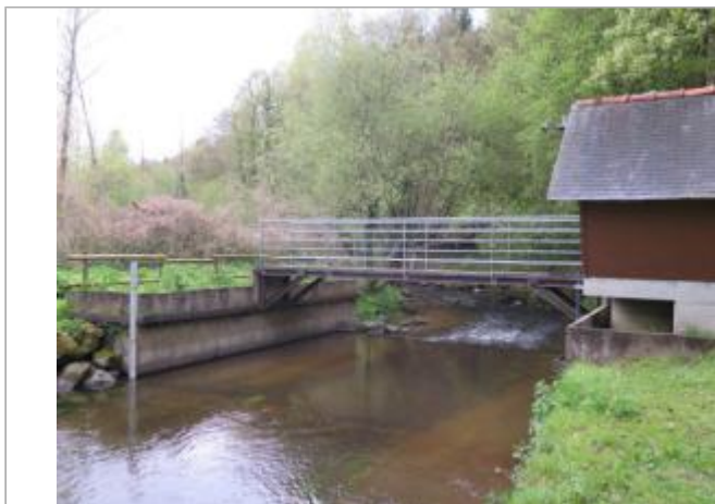
Station limnimétrique du Gouët à Saint-Julien