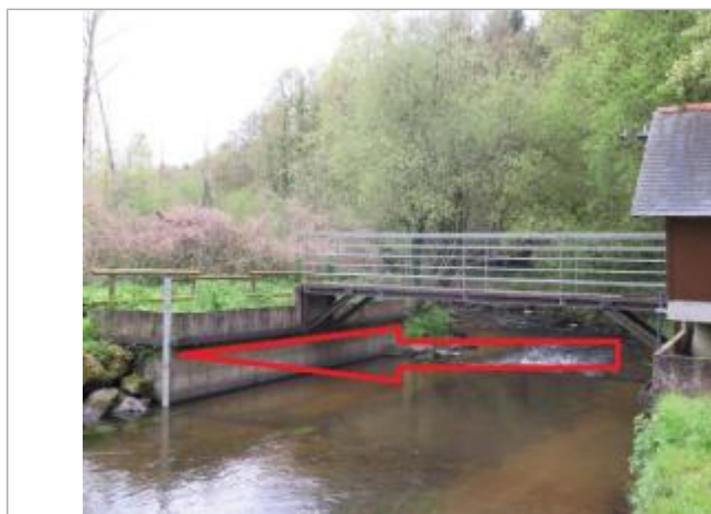
Station limnimétrique du Gouët à Saint-Julien

Altitude calculée de l'eau (en m) : 93.66 m