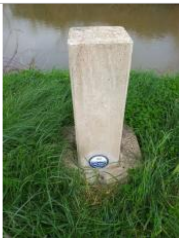
Repère Port de Moricq