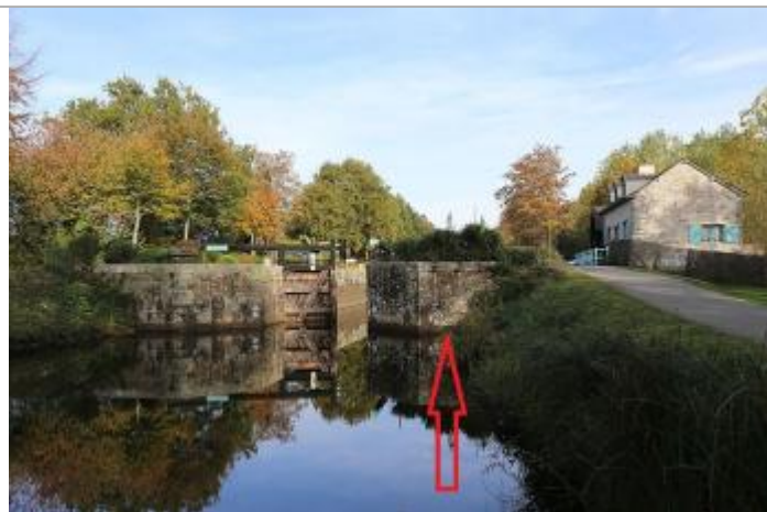
Echelle limnimétrique (disparue) sur le bajoyer aval de l'écluse de Charbonnière à Saint-Grégoire

Altitude calculée de l'eau (en m) : 28.791 m