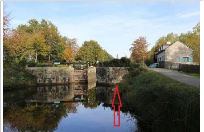
bajoyer aval (échelle limnimétrique disparue) de l'écluse de Charbonnière à Saint-Grégoire