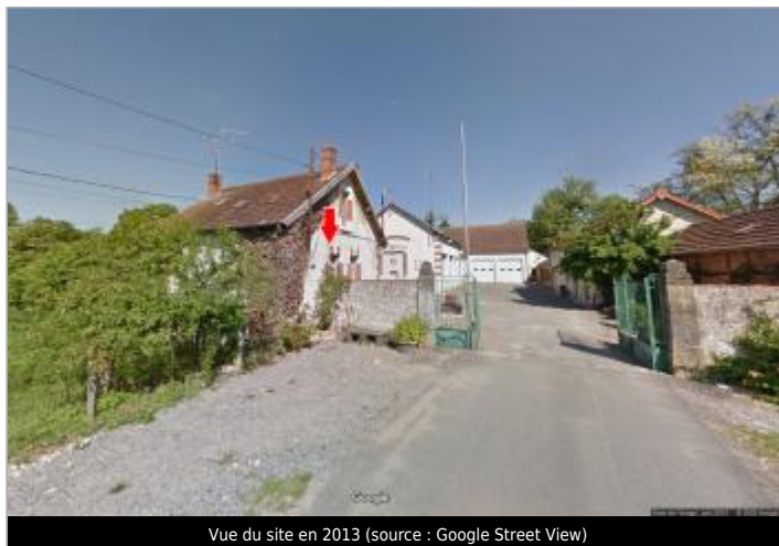
Vue du site en 2013