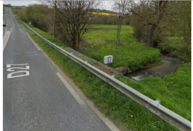
Station limnimétrique de l'Urne à Plédran