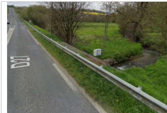
Station limnimétrique de l'Urne à Plédran