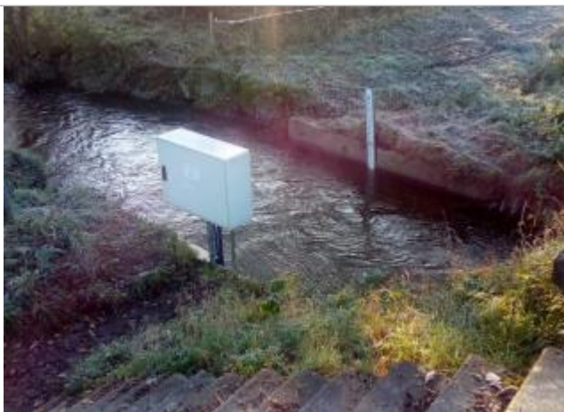
Echelle limnimétrique de la station de l'Urne à Plédran

Altitude calculée de l'eau (en m) : 75.865 m