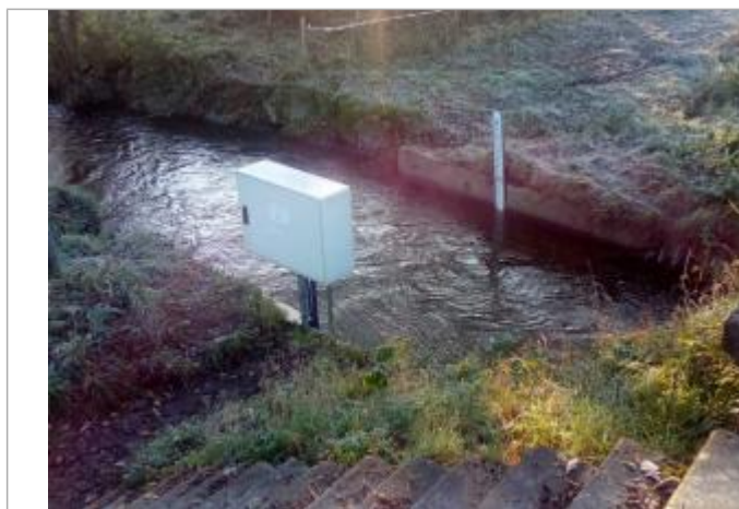
Echelle limnimétrique de la station de l'Urne à Plédran

Altitude calculée de l'eau (en m) : 75.865 m