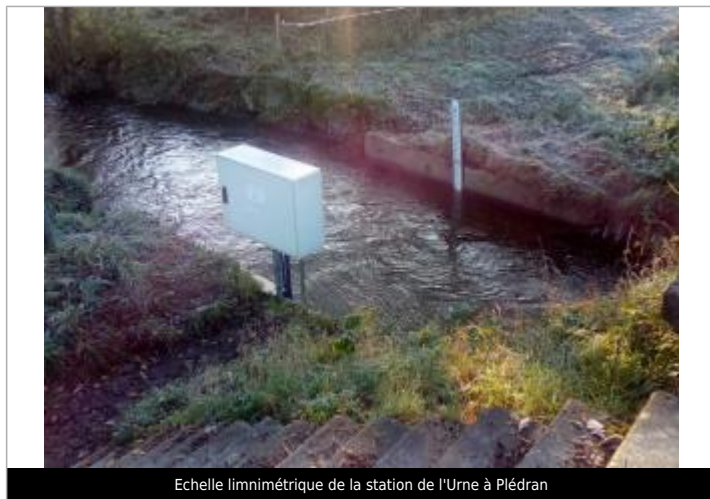
Echelle limnimétrique de la station de l'Urne à Plédran

Altitude calculée de l'eau (en m) : 75.785 m