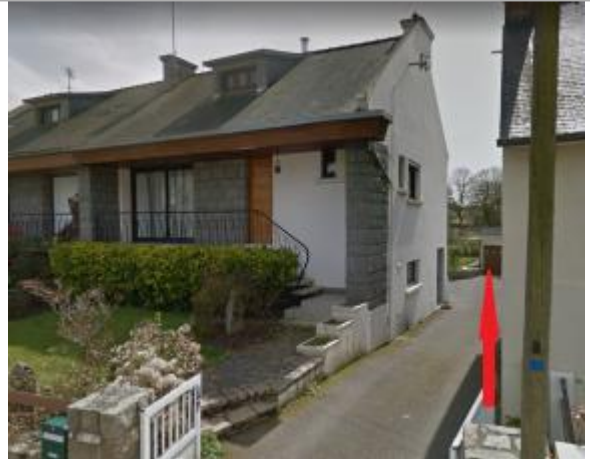
Porte de garage à l'arrière de la maison au 170 rue Paul Langevin