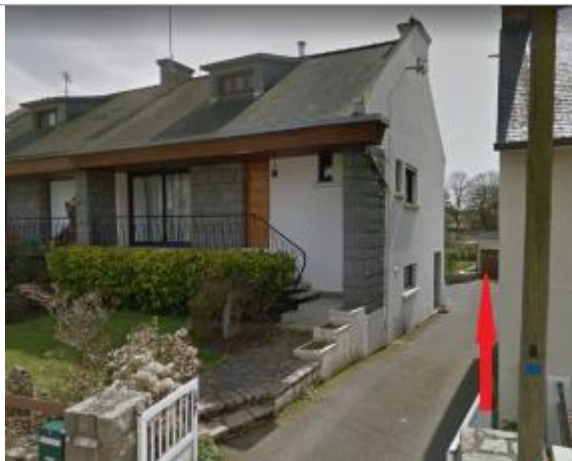
Porte de garage à l'arrière de la maison au 170 rue Paul Langevin