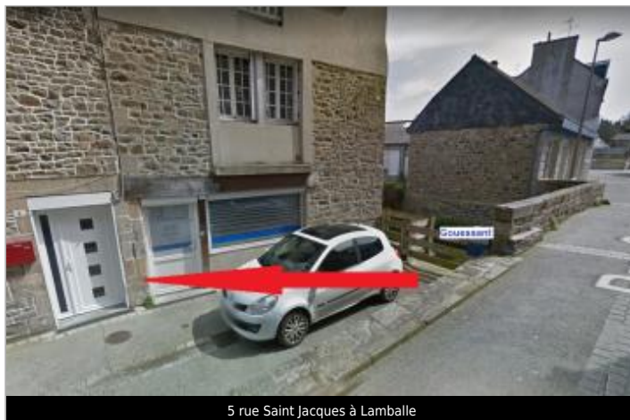
5 rue Saint Jacques à Lamballe