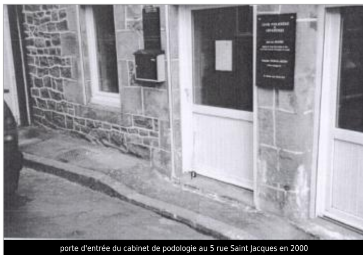
porte d'entrée du cabinet de podologie au 5 rue Saint Jacques en 2000