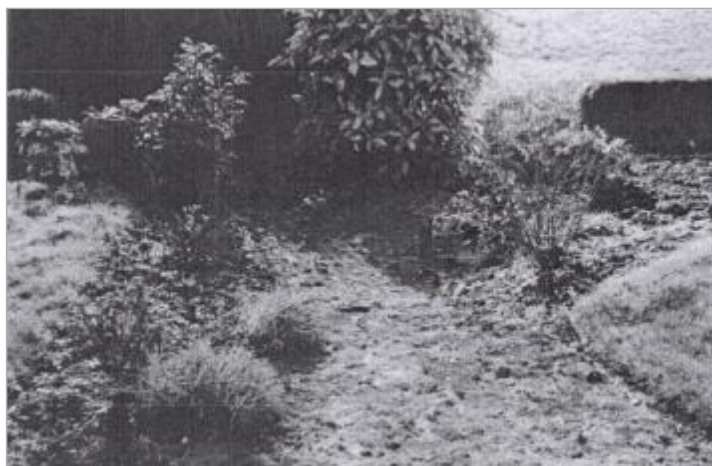
Pierre indiquant le niveau atteint par l'inondation (photo de 2000)