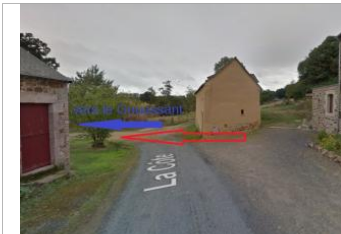
hameau de "La côte" à Andel

Coordonnées WGS84 : X: -2.53337880 / Y: 48.47915400