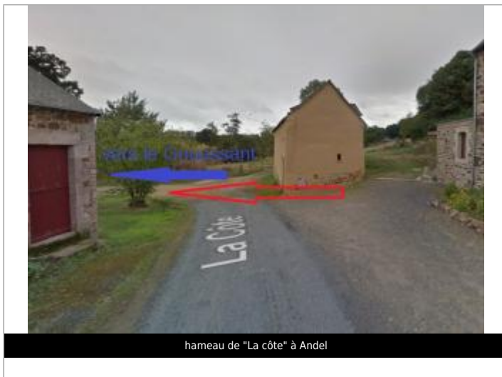
hameau de "La côte" à Andel