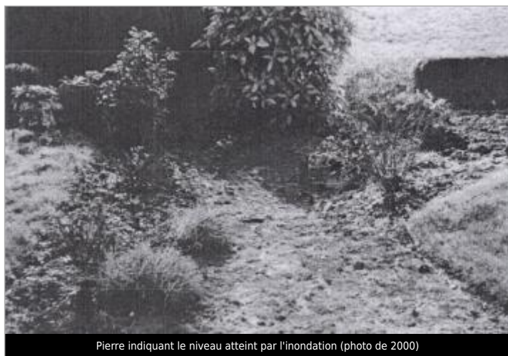
Pierre indiquant le niveau atteint par l'inondation (photo de 2000)