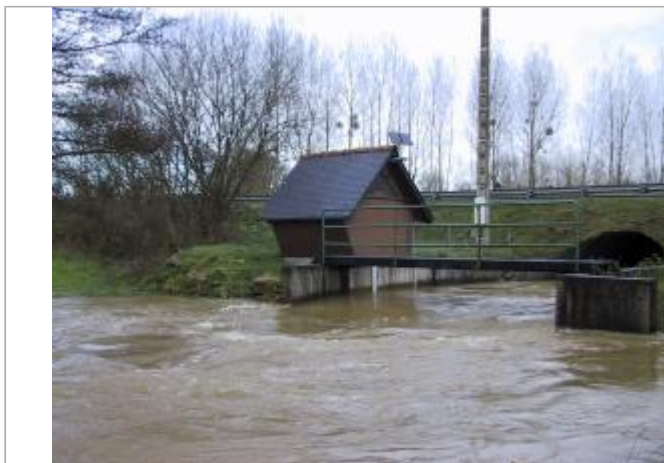
Station limnimétrique de la Rosette à Mégrit