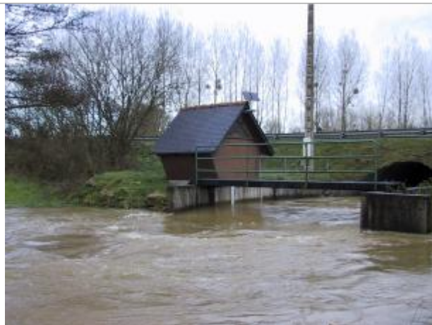
Station limnimétrique de la Rosette à Mégrit