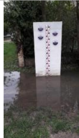
Repère de crue Entente Oise Aisne

Coordonnées RGF93 (ETRS89) : X: 2.1427395 / Y: 49.067426