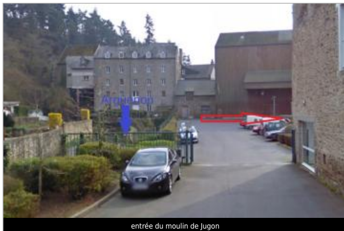
entrée du moulin de Jugon

Coordonnées WGS84 : X: -2.32083100 / Y: 48.40786910