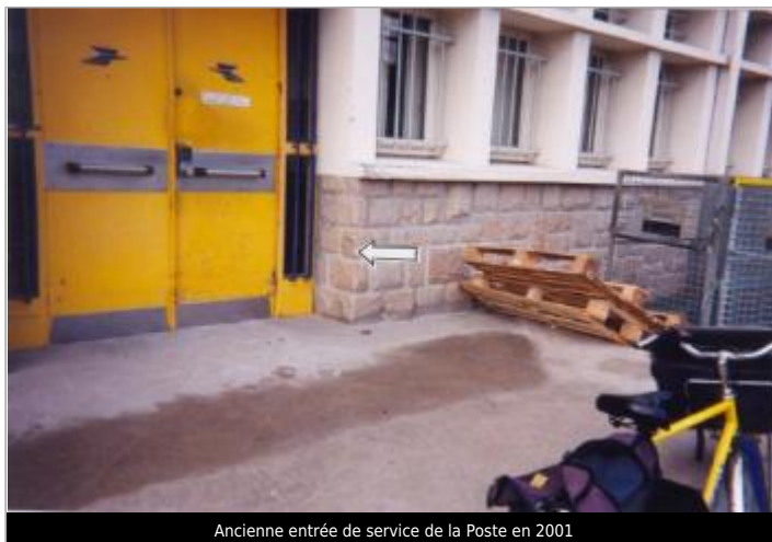
Ancienne entrée de service de la Poste en 2001