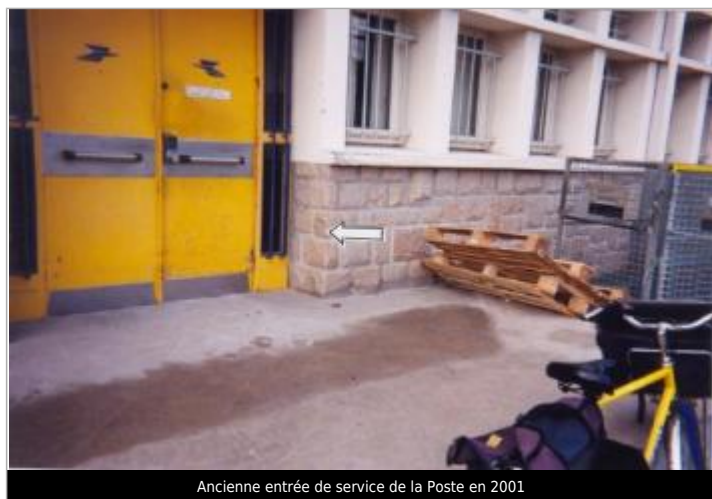
Ancienne entrée de service de la Poste en 2001

Altitude calculée de l'eau (en m) : 8.24 m