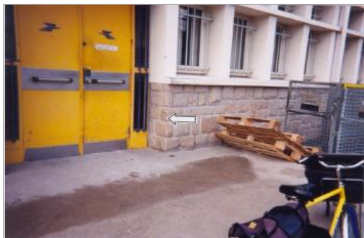
Ancienne entrée de service de la Poste en 2001

SOURCE DE REPÉRAGE : SPC VILAINE COTIERS BRETONS - 08/12/2016