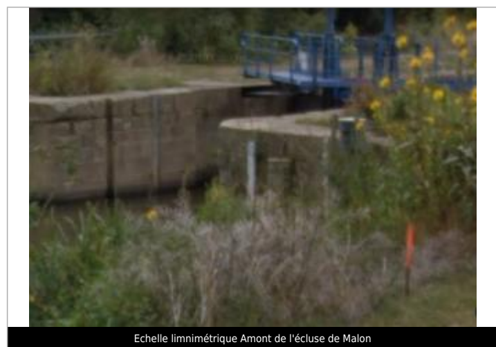
Echelle limnimétrique Amont de l'écluse de Malon

GÉNÉRAL Code : SPC MalonAmont_2001 Date de mise à jour : 22/03/2020 Auteur : SPC VCB