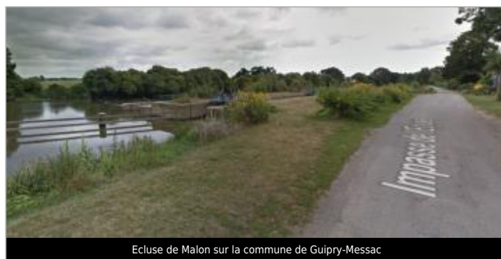
Ecluse de Malon sur la commune de Guipry-Messac

GÉOLOCALISATION Coordonnées WGS84 : X: -1.84265040 / Y: 47.79841280 Coordonnées RGF93 (Lambert 93) X: 337690.62 / Y: 6755337.7 Coordonnées RGF93 (ETRS89) : X: -1.8426504 / Y: 47.7984128 Code Hydro: J---0060 Rive de référence: Droite