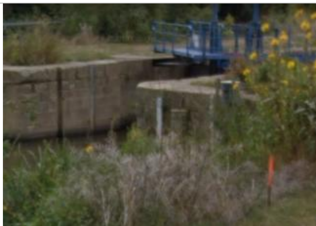
Echelle limnimétrique Amont de l'écluse de Malon

Altitude calculée de l'eau (en m) : 8.403 m