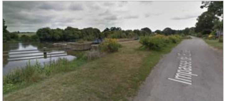
Ecluse de Malon sur la commune de Guipry-Messac

Coordonnées WGS84 : X: -1.84265040 / Y: 47.79841280