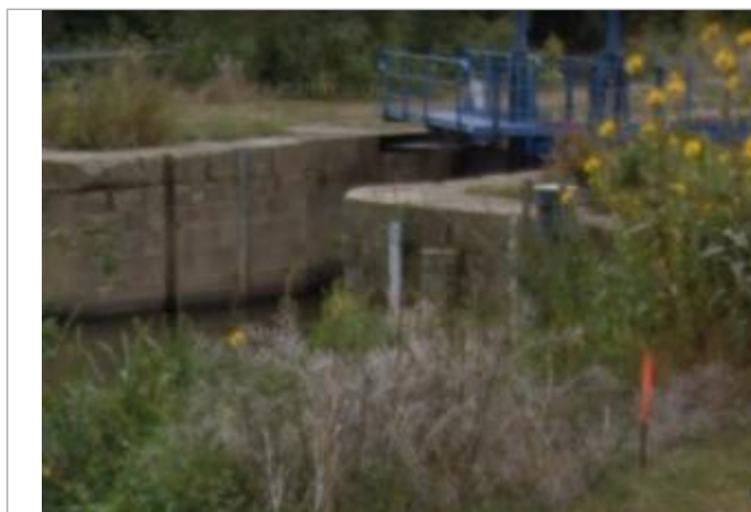
Echelle limnimétrique Amont de l'écluse de Malon

Altitude calculée de l'eau (en m) : 7.963 m