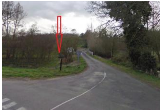
vue globale de l'accès à la station

Coordonnées WGS84 : X: -2.33340920 / Y: 48.40269000