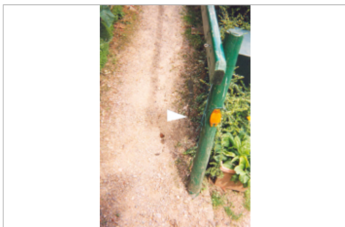
clou sur Barrière en bois à l'ecluse de Boutron

Altitude calculée de l'eau (en m) : 10.8 m